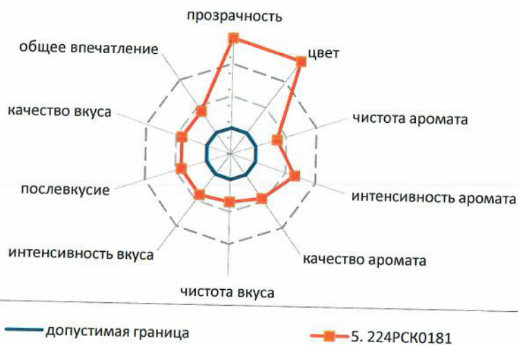
Рис.4.2. Сравнение качества образцов вина тихого (дегустиация 13.09.2021 сет 4)

Протокол не может быть воспроизведен полностью или частично без письменного разрешения Руководителя Сенсорной лаборатории. Полученные результаты относятся к предоставленным Заказчиком образцам. Конец выписки из протокола.