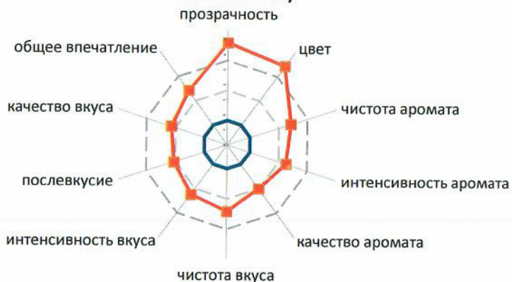
Рис.2.2. Сравнение качества образцов вина тихого (дегустиация 16.09.2021 сет 2)