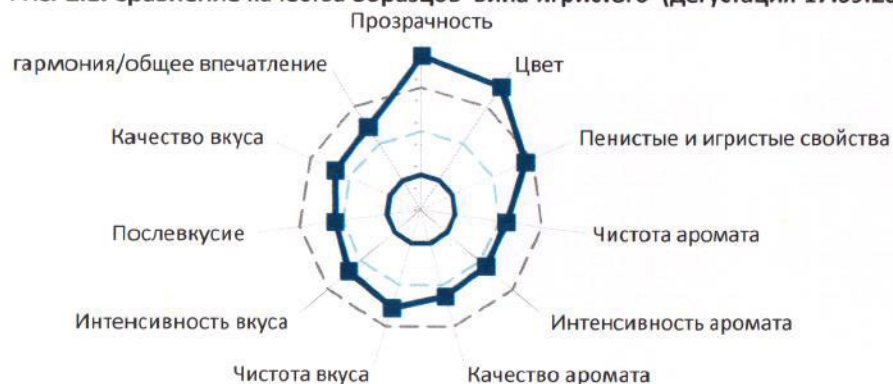
Рис. 1.2. Сравнение качества образцов вина игристого (дегустация 17.09.2020 сет 1)