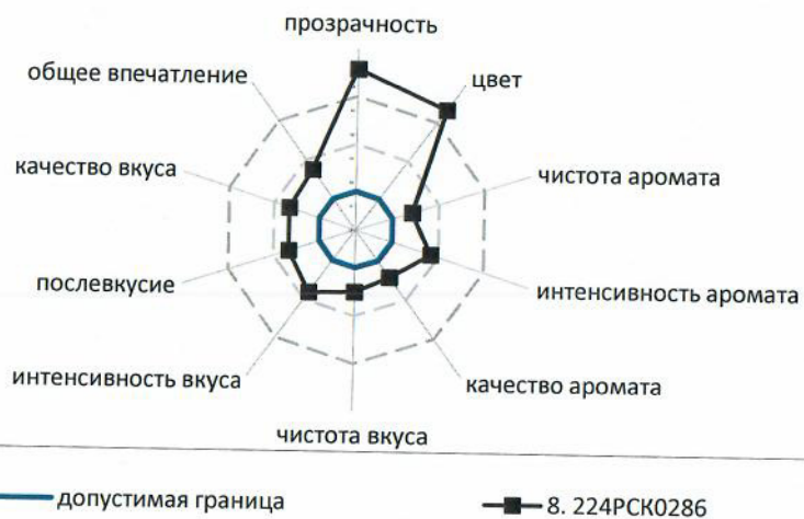
Рис.2.2. Сравнение качества образцов вина тихого (дегустиация 15.09.2021 сет 2)

Протокол не может быть воспроизведен полностью или частично без письменного разрешения Руководителя Сенсорной лаборатории. Полученные результаты относятся к предоставленным Заказчиком образцам. Конец выписки из протокола.