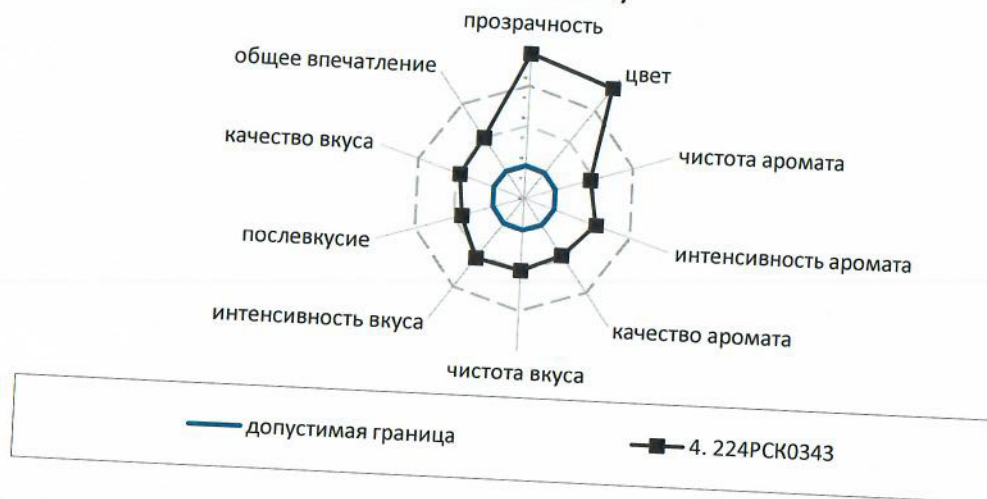
Рис.4.1. Сравнение качества образцов вина тихого (дегустация 17.09.2021 сет 4)

Протокол не может быть воспроизведен полностью или частично без письменного разрешения Руководителя Сенсорной лаборатории. Полученные результаты относятся к предоставленным Заказчиком образцам. Конец выписки из протокола.