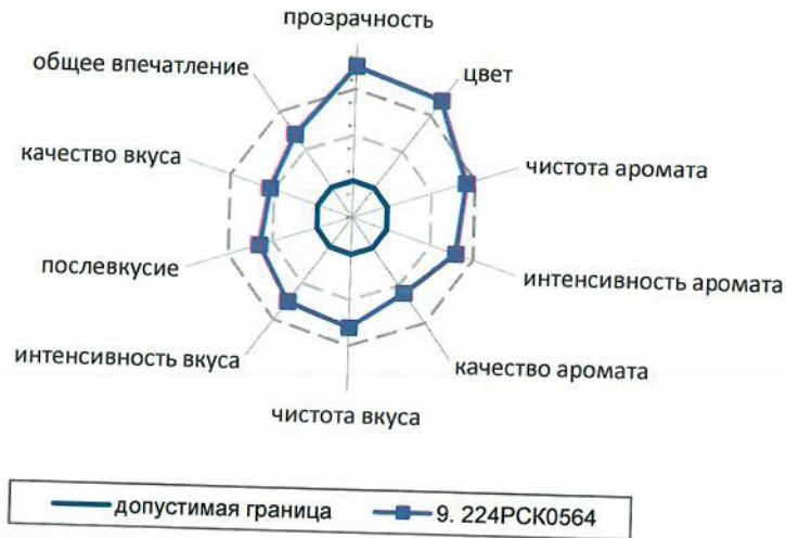
Рис.3.3. Сравнение качества образцов вина тихого (дегустация 24.09.2021 сет 3)

Протокол не может быть воспроизведен полностью или частично без письменного разрешения Руководителя Сенсорной лаборатории. Полученные результаты относятся к предоставленным Заказчиком образцам. Конец выписки из протокола.