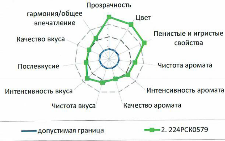
Рис.1.1. Сравнение качества образцов вина игристого (дегустация 24.09.2021 сет 1)

Протокол не может быть воспроизведен полностью или частично без письменного разрешения Руководителя Сенсорной лаборатории. Полученные результаты относятся к предоставленным Заказчиком образцам. Конец выписки из протокола.