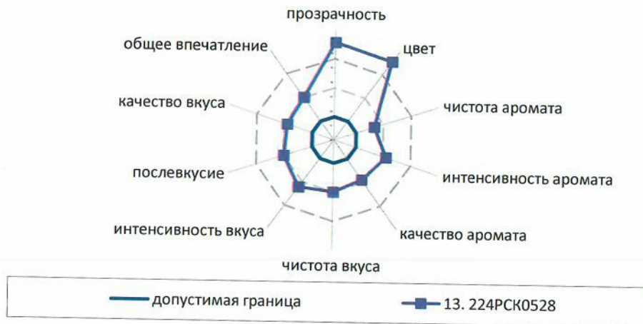
Рис.2.4. Сравнение качества образцов вина тихого (дегустация 23.09.2021 сет 2)

Протокол не может быть воспроизведен полностью или частично без письменного разрешения Руководителя Сенсорной лаборатории. Полученные результаты относятся к предоставленным Заказчиком образцам. Конец выписки из протокола.