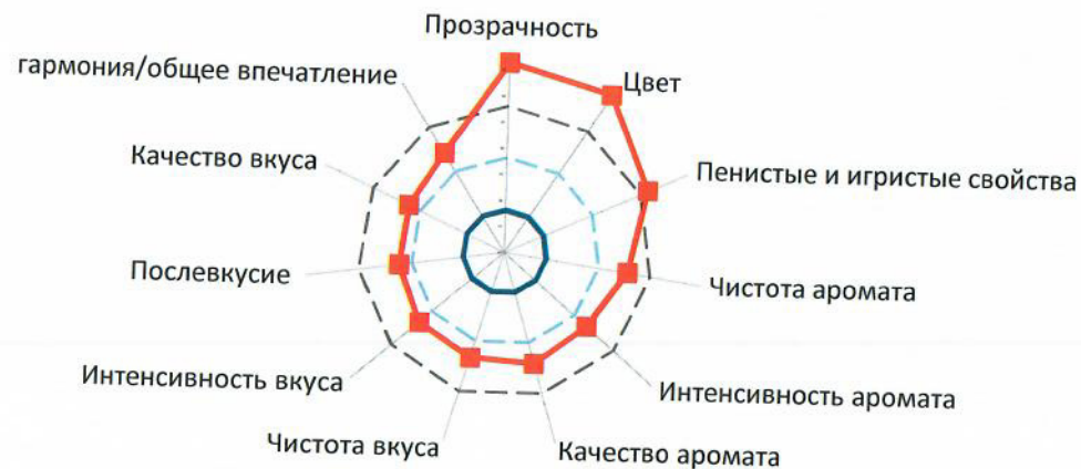
Рис. 1.3. Сравнение качества образцов вина игристого (дегустация 08.09.2021 1сет)