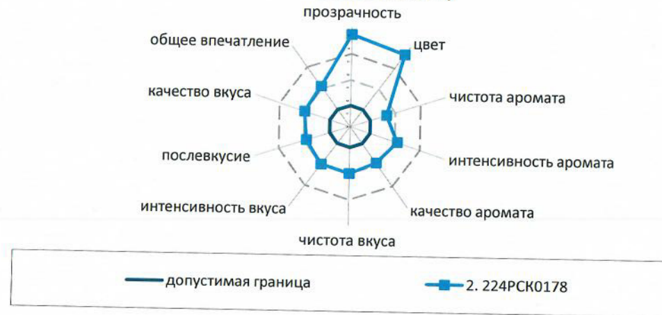
Рис.3.1. Сравнение качества образцов вина тихого (дегустация 13.09.2021 сет 3)

Протокол не может быть воспроизведен полностью или частично без письменного разрешения Руководителя Сенсорной лаборатории. Полученные результаты относятся к предоставленным Заказчиком образцам. Конец выписки из протокола.