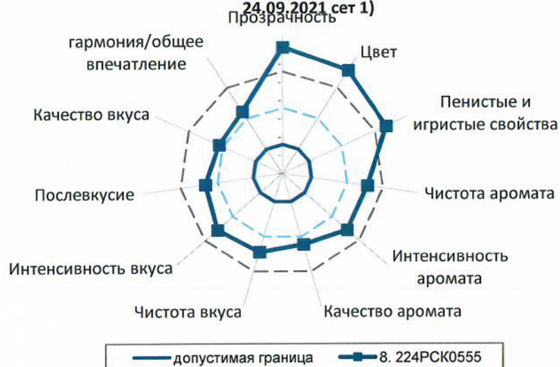
Рис. 1.2. Сравнение качества образцов вина игристого (дегустиация 24.09.2021 сет 1)

Протокол не может быть воспроизведен полностью или частично без письменного разрешения Руководителя Сенсорной лаборатории. Полученные результаты относятся к предоставленным Заказчиком образцам. Конец выписки из протокола.