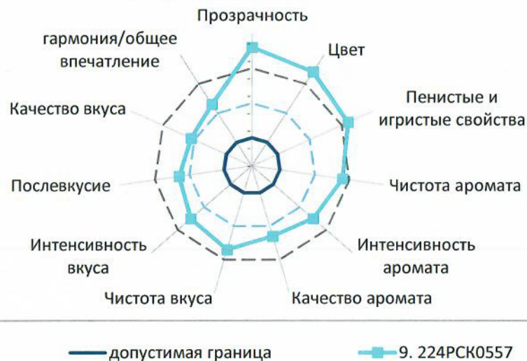
Рис. 1.3. Сравнение качества образцов вина игристого (дегустиция 24.09.2021 1сет)

Протокол не может быть воспроизведен полностью или частично без письменного разрешения Руководителя Сенсорной лаборатории.