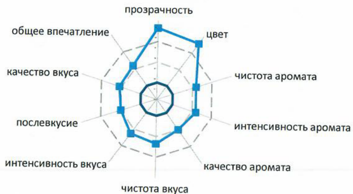
Рис.2.1. Сравнение качества образцов вина тихого (дегустация 15.09.2021 сет 2)