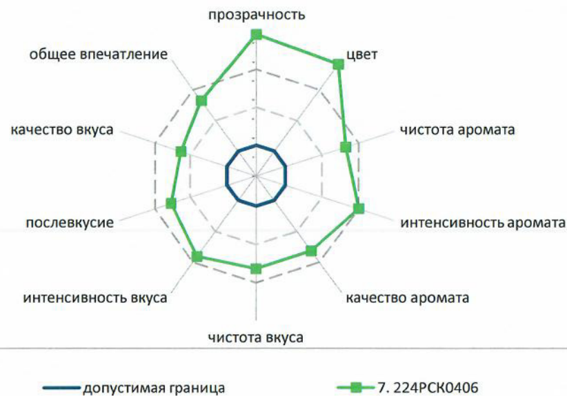
Рис.4.2. Сравнение качества образцов вина тихого (дегустиация 20.09.2021 сет 4)

Протокол не может быть воспроизведен полностью или частично без письменного разрешения Руководителя Сенсорной лаборатории. Полученные результаты относятся к предоставленным Заказчиком образцам. Конец выписки из протокола.