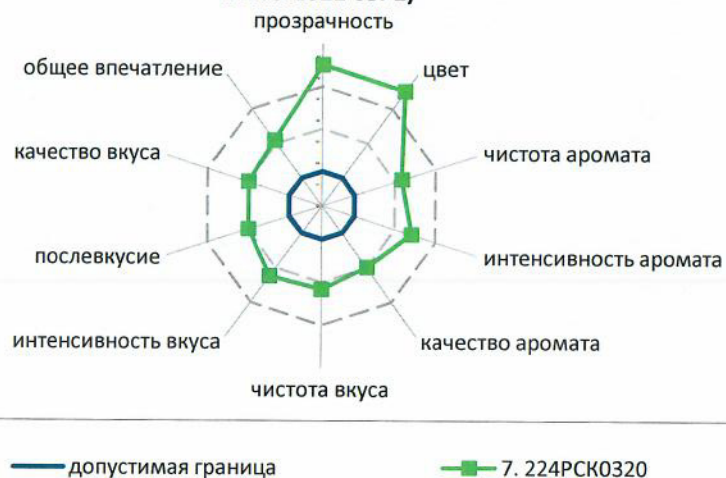
Рис.2.2. Сравнение качества образцов вина тихого (дегустация 16.09.2021 сет 2)

Протокол не может быть воспроизведен полностью или частично без письменного разрешения Руководителя Сенсорной лаборатории.