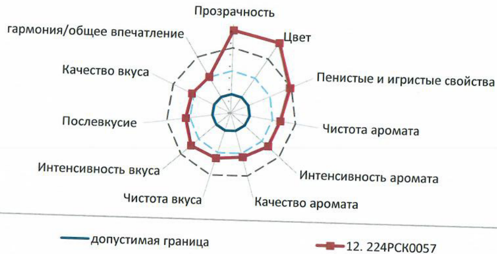
Рис. 2.3. Сравнение качества образцов вина игристого (дегустация 08.09.2021 2сет)

Протокол не может быть воспроизведен полностью или частично без письменного разрешения Руководителя Сенсорной лаборатории. Полученные результаты относятся к предоставленным Заказчиком образцам. Конец выписки из протокола.