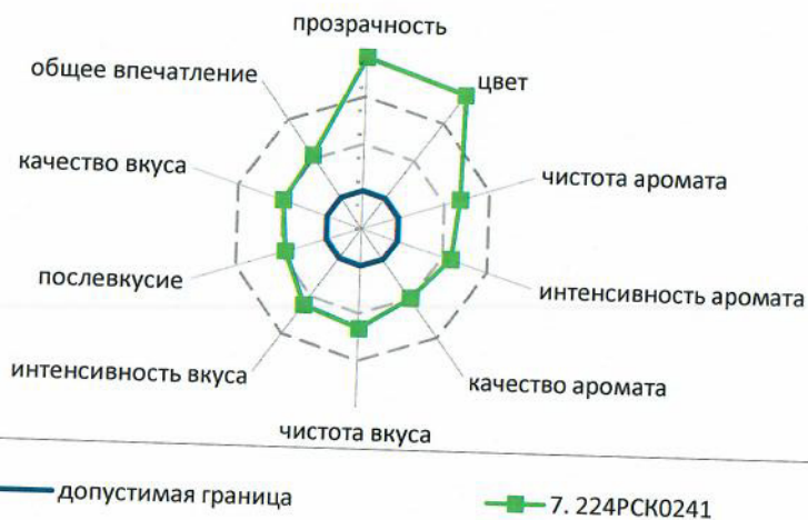
Рис.4.2. Сравнение качества образцов вина тихого (дегустиация 14.09.2021 сет 4)

Протокол не может быть воспроизведен полностью или частично без письменного разрешения Руководителя Сенсорной лаборатории. Полученные результаты относятся к предоставленным Заказчиком образцам. Конец выписки из протокола.