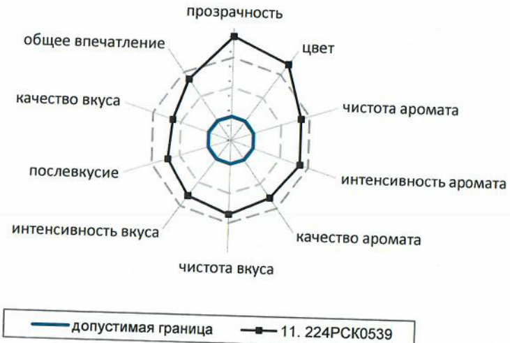
Рис.2.3. Сравнение качества образцов вина тихого (дегустация 27.09.2021 сет 2)

Протокол не может быть воспроизведен полностью или частично без письменного разрешения Руководителя Сенсорной лаборатории. Полученные результаты относятся к предоставленным Заказчиком образцам. Конец выписки из протокола.