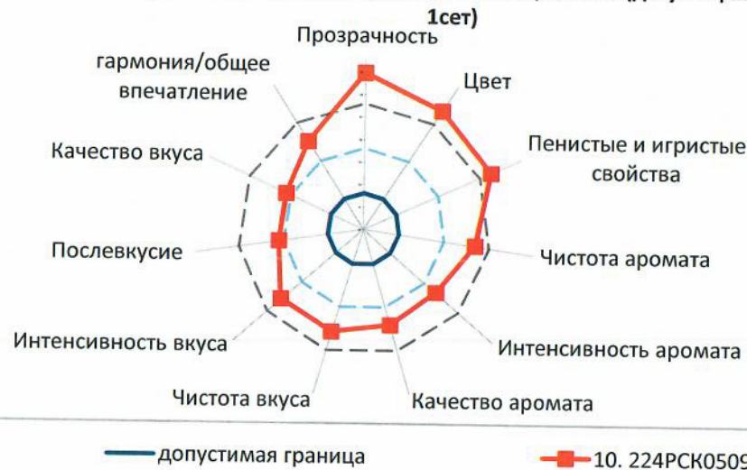
Рис. 1.3. Сравнение качества образцов вина игристого (дегустация 23.09.2021 1сет)

Протокол не может быть воспроизведен полностью или частично без письменного разрешения Руководителя Сенсорной лаборатории. Полученные результаты относятся к предоставленным Заказчиком образцам. Конец выписки из протокола.