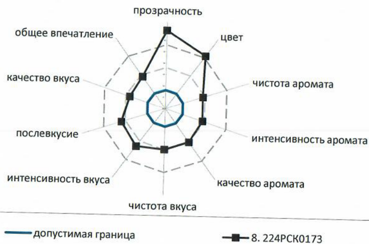
Рис.4.2. Сравнение качества образцов вина тихого (дегустация 13.09.2021 сет 4)

Протокол не может быть воспроизведен полностью или частично без письменного разрешения Руководителя Сенсорной лаборатории. Полученные результаты относятся к предоставленным Заказчиком образцам. Конец выписки из протокола.