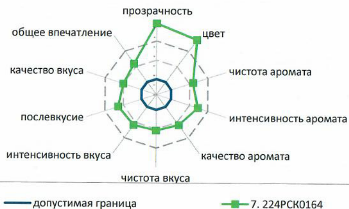
Рис.4.2. Сравнение качества образцов вина тихого (дегустация 10.09.2021 сет 4)

Протокол не может быть воспроизведен полностью или частично без письменного разрешения Руководителя Сенсорной лаборатории.