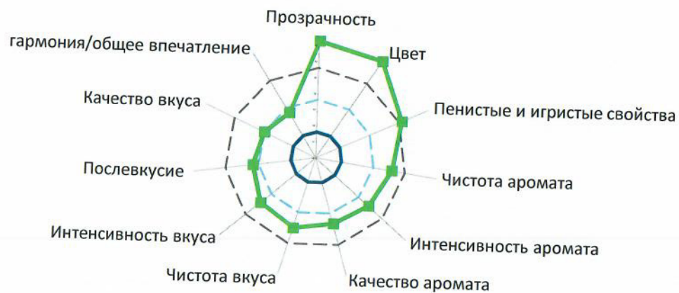
Рис. 2.3. Сравнение качества образцов вина игристого (дегустация 08.09.2021 2сет)