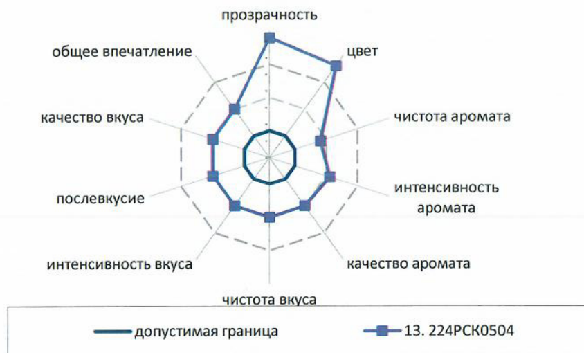
Рис.2.4. Сравнение качества образцов вина тихого (дегустиация 22.09.2021 сет 2)

Протокол не может быть воспроизведен полностью или частично без письменного разрешения Руководителя Сенсорной лаборатории.