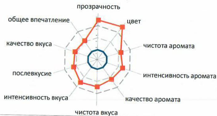
Рис.3.4. Сравнение качества образцов вина тихого (дегустация 16.09.2021 сет 3)