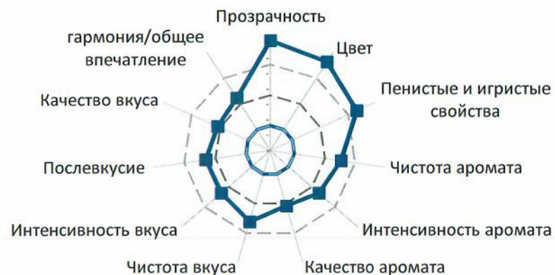
Рис.1.1. Сравнение качества образцов вина игристого (дегустация 21.09.2021 сет 1)