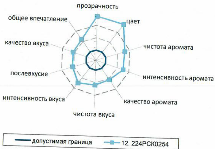
Рис.3.3. Сравнение качества образцов вина тихого (дегустация 14.09.2021 сет 3)

Протокол не может быть воспроизведен полностью или частично без письменного разрешения Руководителя Сенсорной лаборатории. Полученные результаты относятся к предоставленным Заказчиком образцам. Конец выписки из протокола.