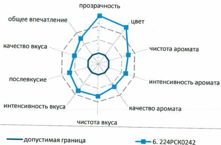
Рис.1.2. Сравнение качества образцов вина тихого (дегустация 14.09.2021 сет 1)

Протокол не может быть воспроизведен полностью или частично без письменного разрешения Руководителя Сенсорной лаборатории.