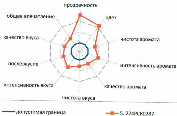
Рис.3.2. Сравнение качества образцов вина тихого (дегустация 15.09.2021 сет 3)

Протокол не может быть воспроизведен полностью или частично без письменного разрешения Руководителя Сенсорной лаборатории. Полученные результаты относятся к предоставленным Заказчиком образцам. Конец выписки из протокола.