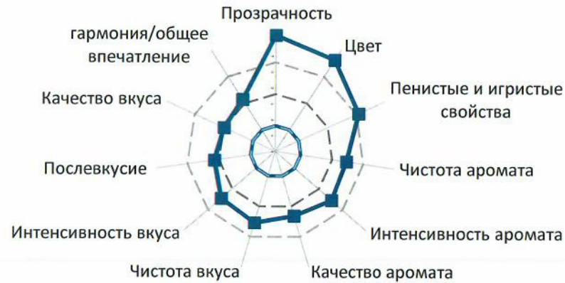
Рис.1.1. Сравнение качества образцов вина игристого (дегустиация 22.09.2021 сет 1)