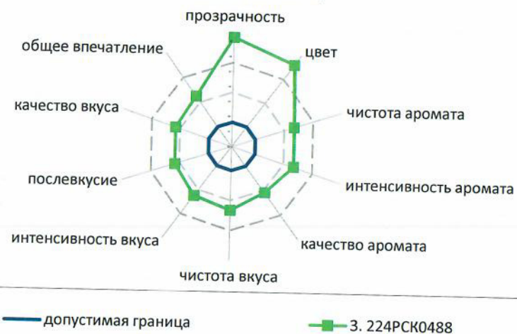
Рис.3.1. Сравнение качества образцов вина тихого (дегустиация 22.09.2021 сет 3)

Протокол не может быть воспроизведен полностью или частично без письменного разрешения Руководителя Сенсорной лаборатории. Полученные результаты относятся к предоставленным Заказчиком образцам. Конец выписки из протокола.