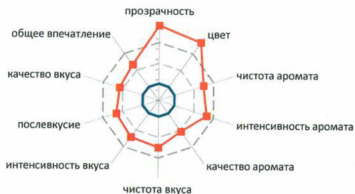
Рис.4.3. Сравнение качества образцов вина тихого (дегустация 10.09.2021 сет 4)