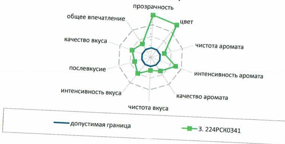
Рис.4.1. Сравнение качества образцов вина тихого (дегустация 17.09.2021 сет 4)

Протокол не может быть воспроизведен полностью или частично без письменного разрешения Руководителя Сенсорной лаборатории. Полученные результаты относятся к предоставленным Заказчиком образцам. Конец выписки из протокола.