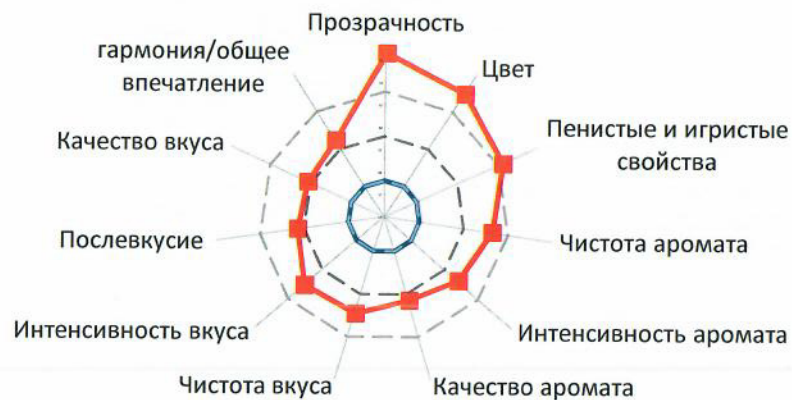
Рис.1.1. Сравнение качества образцов вина игристого (дегустация 22.09.2021 сет 1)