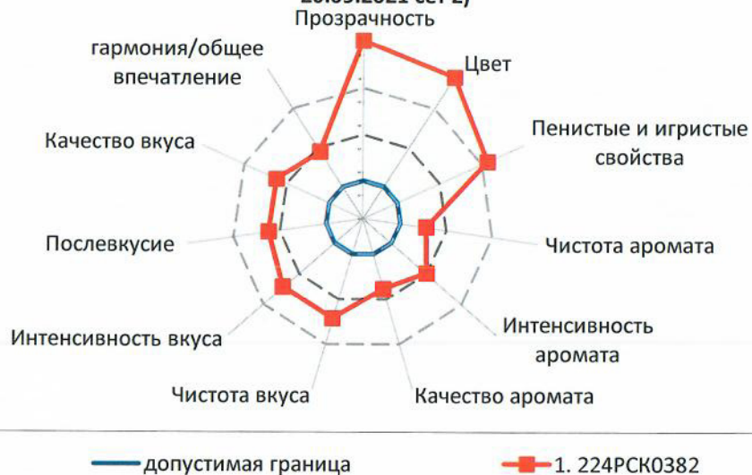
Рис.2.1. Сравнение качества образцов вина игристого (дегустиация 20.09.2021 сет 2)

Протокол не может быть воспроизведен полностью или частично без письменного разрешения Руководителя Сенсорной лаборатории.