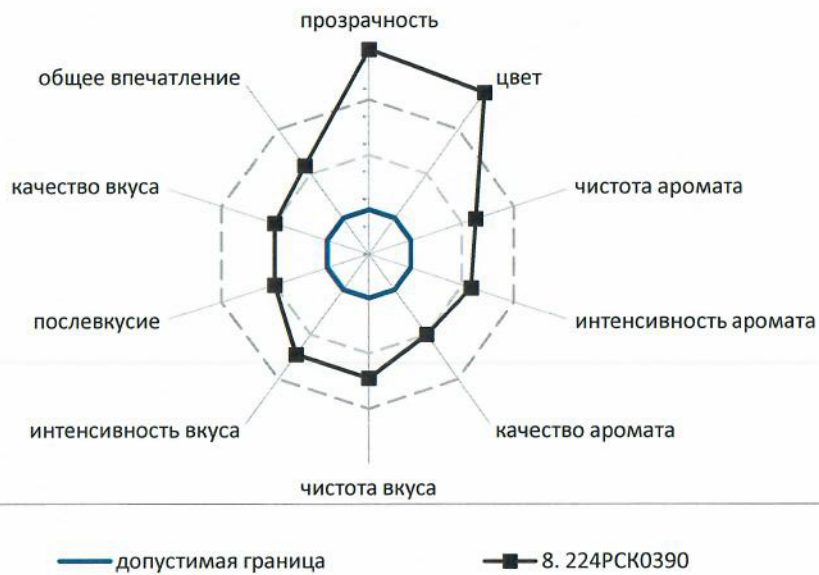
Рис.4.2. Сравнение качества образцов вина тихого (дегустация 20.09.2021 сет 4)

Протокол не может быть воспроизведен полностью или частично без письменного разрешения Руководителя Сенсорной лаборатории.