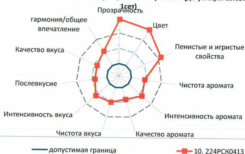
Рис. 1.3. Сравнение качества образцов вина игристого (дегустация 20.09.2021 1сет)

Протокол не может быть воспроизведен полностью или частично без письменного разрешения Руководителя Сенсорной лаборатории. Полученные результаты относятся к предоставленным Заказчиком образцам. Конец выписки из протокола.