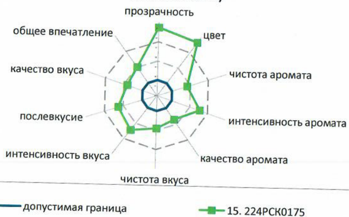
Рис.3.4. Сравнение качества образцов вина тихого (дегустация 13.09.2021 сет 3)

Протокол не может быть воспроизведен полностью или частично без письменного разрешения Руководителя Сенсорной лаборатории. Полученные результаты относятся к предоставленным Заказчиком образцам. Конец выписки из протокола.