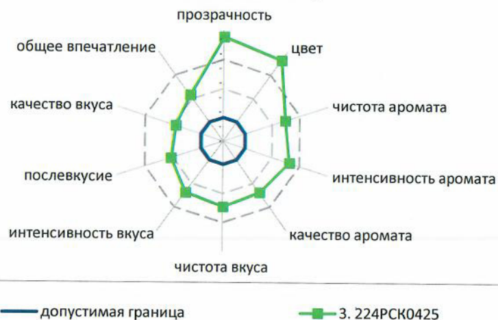
Рис.4.1. Сравнение качества образцов вина тихого (дегустиация 21.09.2021 сеп 4)

Протокол не может быть воспроизведен полностью или частично без письменного разрешения Руководителя Сенсорной лаборатории. Полученные результаты относятся к предоставленным Заказчиком образцам. Конец выписки из протокола.