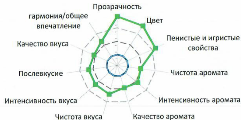
Рис.1.1. Сравнение качества образцов вина игристого (дегустация 21.09.2021 сет 1)