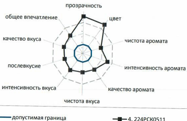
Рис.2.1. Сравнение качества образцов вина тихого (дегустация 23.09.2021 сет 2)

Протокол не может быть воспроизведен полностью или частично без письменного разрешения Руководителя Сенсорной лаборатории.