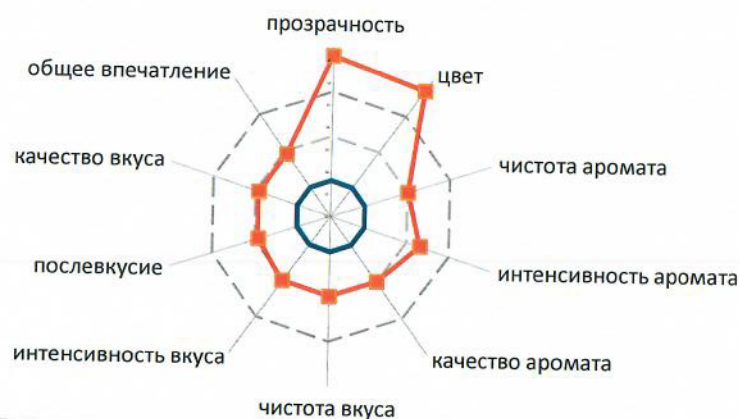
Рис.3.2. Сравнение качества образцов вина тихого (дегустация 13.09.2021 сет 3)