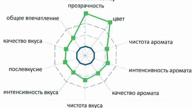
Рис.2.1. Сравнение качества образцов вина тихого (дегустация 22.09.2021 сет 2)