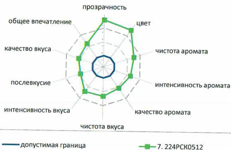
Рис.2.2. Сравнение качества образцов вина тихого (дегустация 23.09.2021 сет 2)

Протокол не может быть воспроизведен полностью или частично без письменного разрешения Руководителя Сенсорной лаборатории.