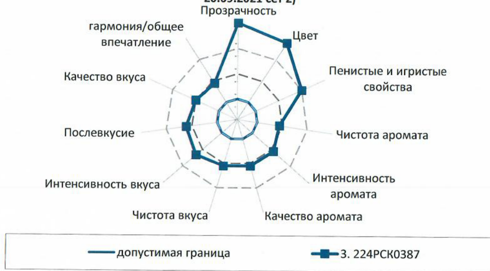
Рис.2.1. Сравнение качества образцов вина игристого (дегустиация 20.09.2021 сет 2)

Протокол не может быть воспроизведен полностью или частично без письменного разрешения Руководителя Сенсорной лаборатории. Полученные результаты относятся к предоставленным Заказчиком образцам. Конец выписки из протокола.