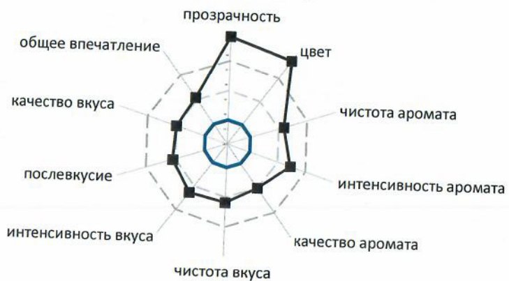
Рис.2.2. Сравнение качества образцов вина тихого (дегустиация 17.09.2021 сет 2)