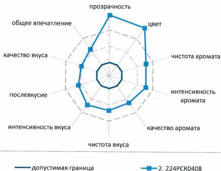
Рис.4.1. Сравнение качества образцов вина тихого (дегустиция 20.09.2021 сет 4)

Протокол не может быть воспроизведен полностью или частично без письменного разрешения Руководителя Сенсорной лаборатории.