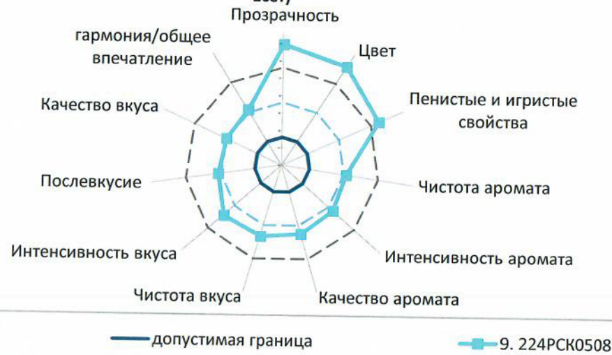
Рис. 1.3. Сравнение качества образцов вина игристого (дегустация 23.09.2021 1сет)

Протокол не может быть воспроизведен полностью или частично без письменного разрешения Руководителя Сенсорной лаборатории. Полученные результаты относятся к предоставленным Заказчиком образцам. Конец выписки из протокола.