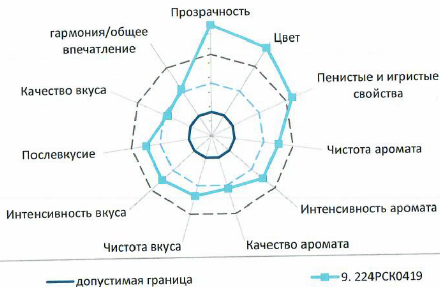
Рис. 2.3. Сравнение качества образцов вина игристого (дегустиция 20.09.2021 2сет)

Протокол не может быть воспроизведен полностью или частично без письменного разрешения Руководителя Сенсорной лаборатории. Полученные результаты относятся к предоставленным Заказчиком образцам. Конец выписки из протокола.