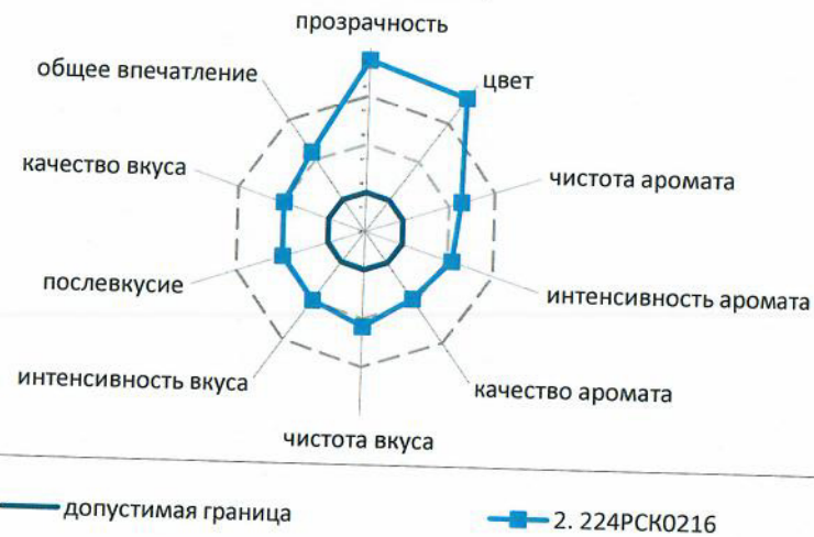
Рис.3.1. Сравнение качества образцов вина тихого (дегустация 14.09.2021 сет 3)

Протокол не может быть воспроизведен полностью или частично без письменного разрешения Руководителя Сенсорной лаборатории. Полученные результаты относятся к предоставленным Заказчиком образцам. Конец выписки из протокола.