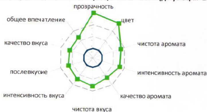
Рис.3.2. Сравнение качества образцов вина тихого (дегустация 18.09.2020 сет 3)